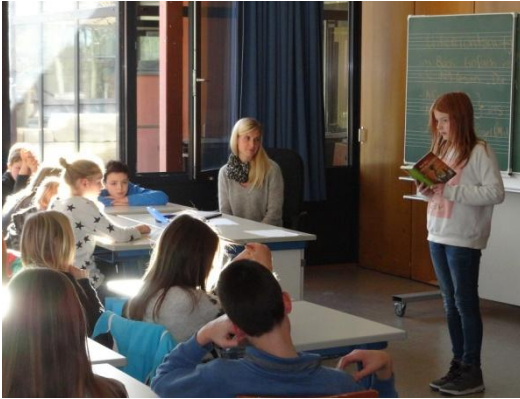
Frau Happel lauscht gespannt Salome aus der 6b