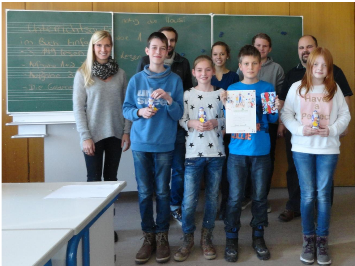
Freudige Gesichter bei den Lesefreunden und der Jury nach dem erfolgreichen Lesewettbewerb